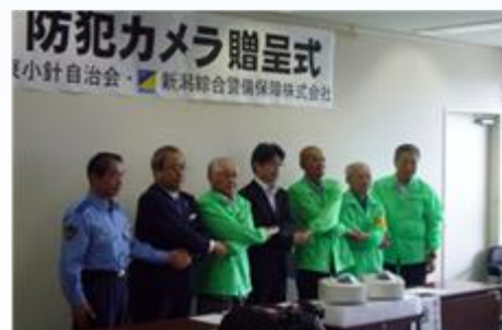
防犯(街頭)カメラ贈呈