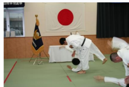
トップアスリート合宿派遣(イメージ)