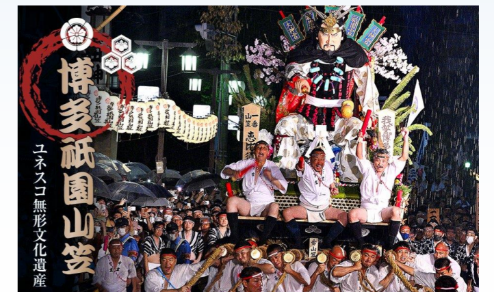
当社が15年間交流してきた博多祇園山笠