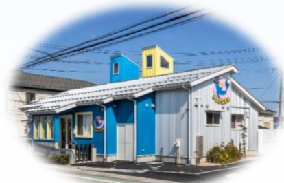
企業主導型保育園「いるか保育園」